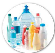
bouteilles et flacons en plastique

Et pour tous à compter du 1 er juillet 2021