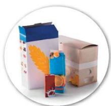
cartons et briques alimentaires